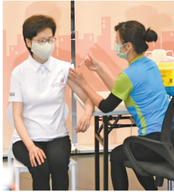
特首林鄭月娥打第一針疫苗，冀可為市民作表率。

林鄭月娥休息30分鐘後會見記者，稱希望今次活動可以起到示範作用，讓市民放心接種。她形容這是大家奮鬥一年後帶來的曙光，沒有成功研發及有效應用的疫苗，世界各地都難以走出困境。她希望全港市民積極接種疫苗，產生抗體對抗病毒，保護自己及家人朋友，保護社區，減少傳播。