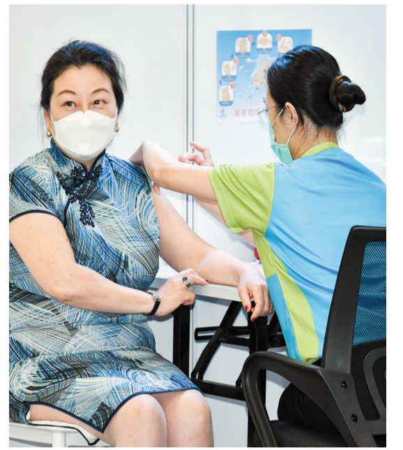
律政司司長鄭若驊亦已打了第一針，財政司司長陳茂波則將於下周接種。

她續指，經過一年抗疫，香港各行各業大受打擊，有必要與其他地區恢復正常往來，未來特區政府的工作一步一步，非常緊密，接種計劃將展開網上登記，優先組可預約，本月26日經正式預約的市民可按既定時間接受接種，另一隻疫苗復必泰亦會很快抵港，屆時將為安老院、安老院員工、殘疾人士等展開另一輪外展接種工作。