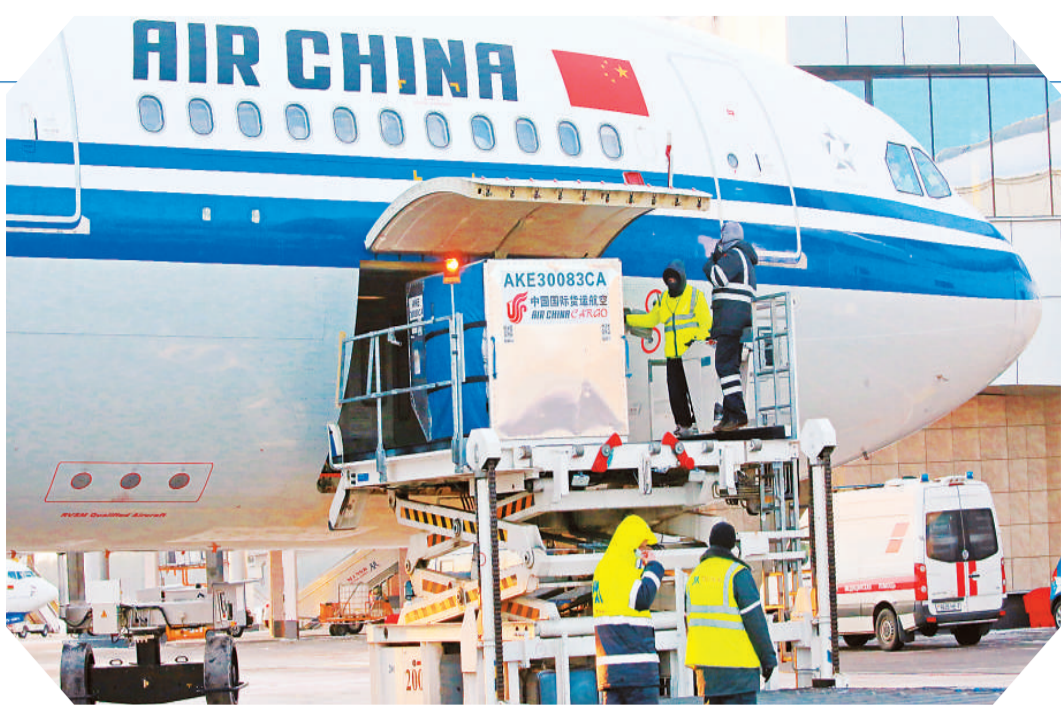
图为二月十九日,在白俄罗斯首都明斯克,机场工作人员从飞机上卸载中国新冠疫苗。