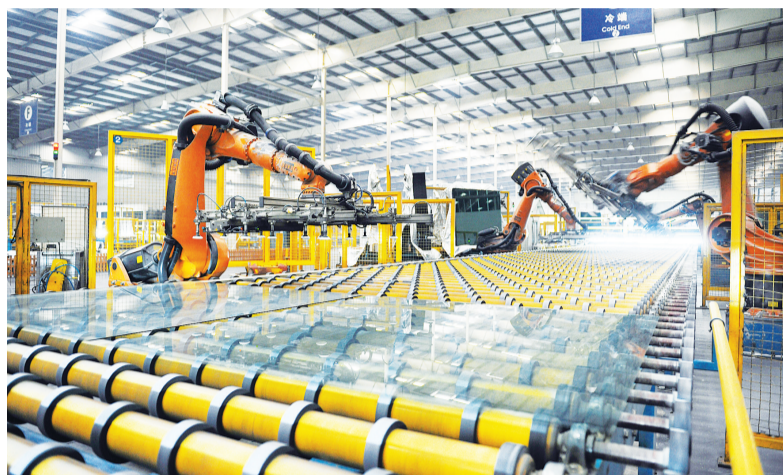
福耀玻璃自动化生产线。(资料图片)

《福州市“招商效率和招商质量提升工程”工作方案》提出,要突出央企国企合资、重大产业项目、现有企业提升项目等三个重点,做细签约、开工、竣工等三个关键环节,精准推动招商效率和招商质量提升,促进产业高质量发展。2021年全市新落地产业项目560个以上(不含房地产),单个项目总投资一产不低