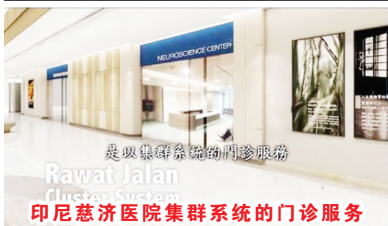
是以集群系统的門診服務 Rawat Jalan Cluster System 印尼慈济医院集群系统的门诊服务