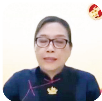
(Like Hermansjah) 致词