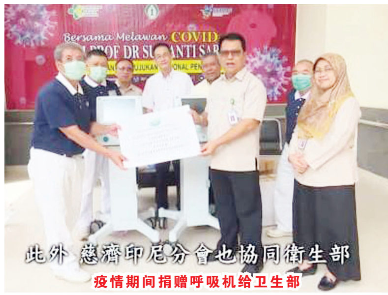
此外 慈济印尼分会也协同卫生部 疫情期间捐赠呼吸机给卫生部