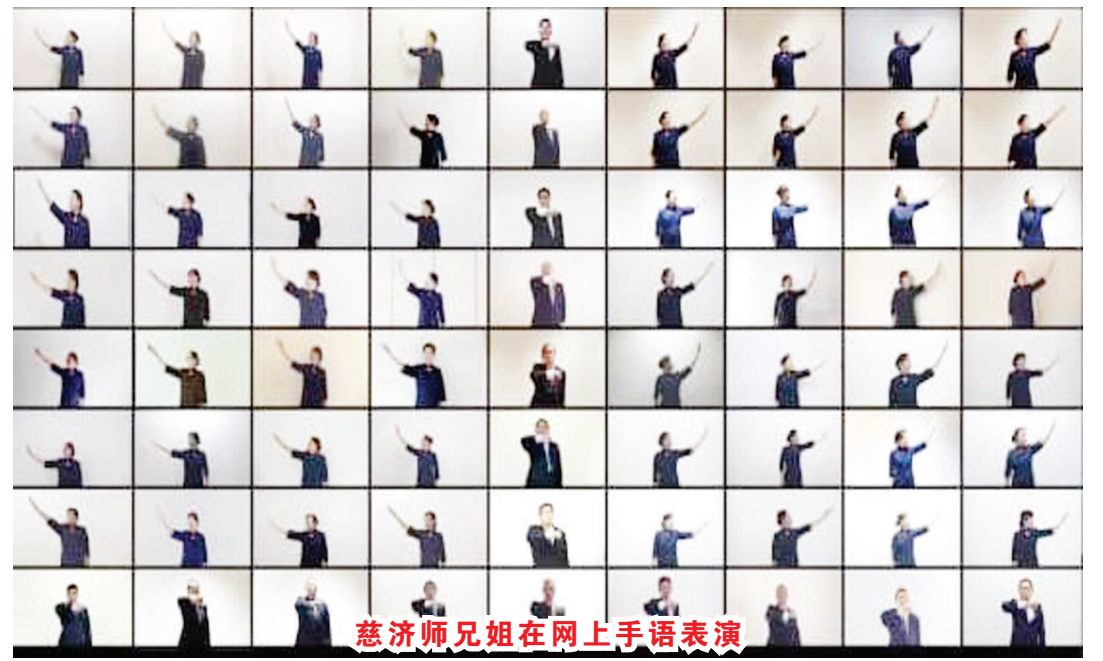
慈济师兄姐在网上手語表演