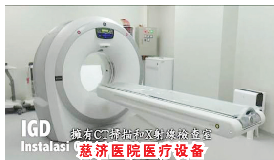
擁有CT掃描和X射線檢查室 IGD Instalasi 慈济医院医疗设备