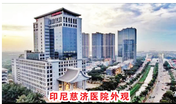
印尼慈济医院外观