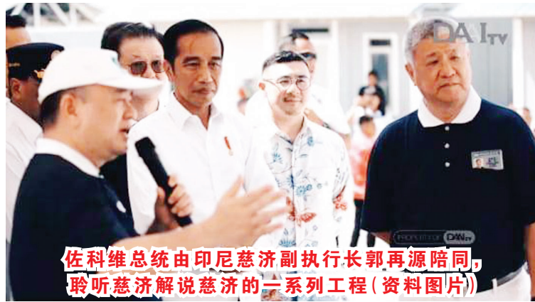
佐科维总统由印尼慈济副执行长郭再源陪同, 聆听慈济解说慈济的一系列工程(资料图片)