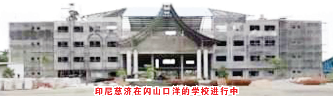
印尼慈济在闪山口洋的学校进行中