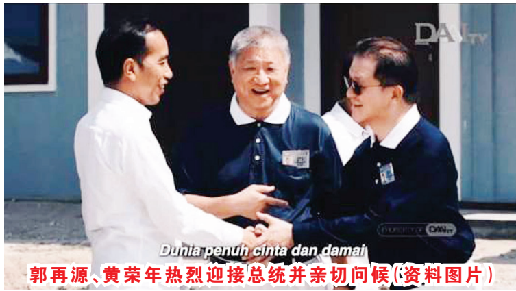
郭再源、黄荣年热烈欢迎总统并亲切问候(资料图片)