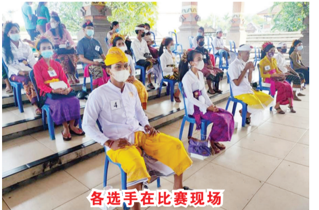
各选手在比赛现场