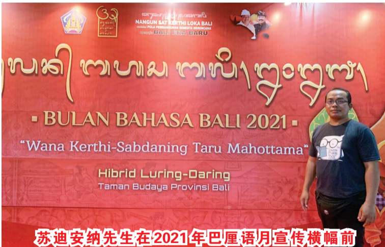
苏迪安纳先生在2021年巴厘语月宣传横幅前