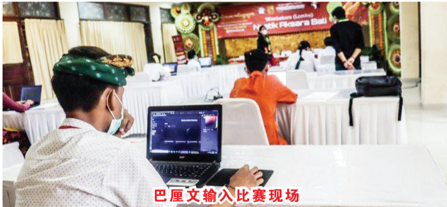
巴厘文输入比赛现场

语言和文化是紧密相连的,在全球化的未来,希望巴厘语能够继续更好地发展和传承;同时,更多在巴厘岛驻足的游客和海外人士们感受到巴厘语的精髓和美丽。本报记者 叶露