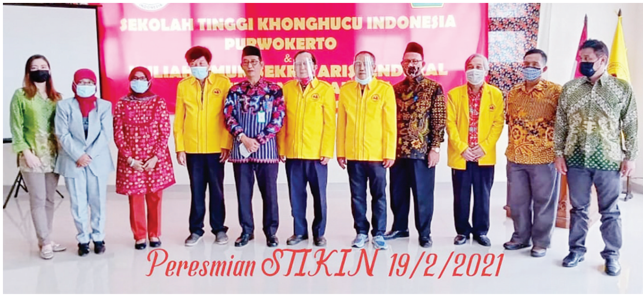
印尼儒教大学理事开幕后合影