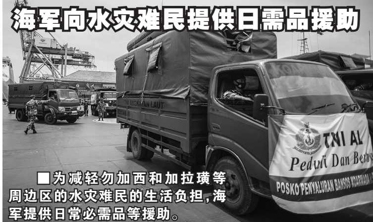
为减轻勿加西和加拉瓏等周边地区的水灾难民的生活负担,海军提供日常必需品等援助。

阿利在国家公出席委任仪式后表示,当前的工作小组专注于要筹备足够的资金来提高社会卫保制度的持续性。他坦承有剩余的款项,但如从资产方面来看仍有很大的赤字。