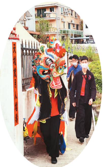
图为“舞麒麟”表演队走街串户。