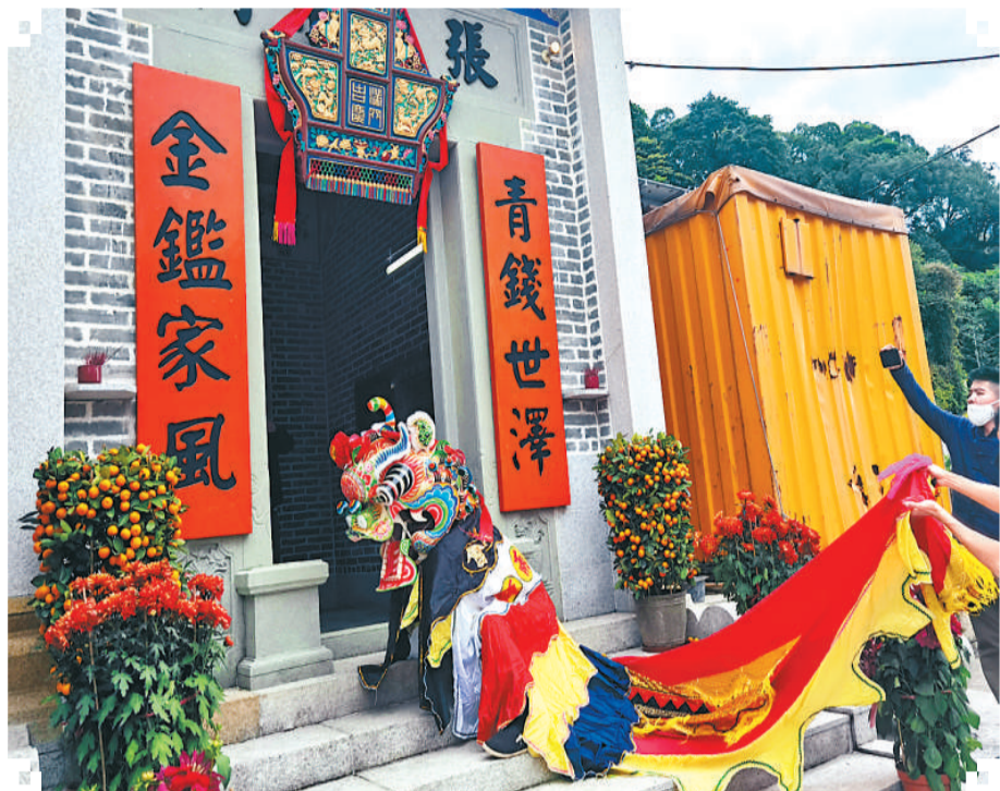
图为“舞麒麟”表演队到村内宗祠表演。