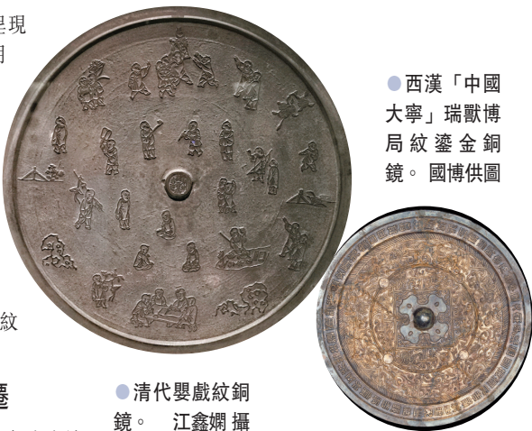
西漢「中國大寧」瑞獸博局紋鑿金銅鏡。國博供圖

其中，高士宴樂紋嵌螺鈿銅鏡1955年出土於河南洛陽唐墓。鏡背嵌螺鈿刻畫人物、樹木、鳥鵲等。鈕上方一株花樹，樹兩側各一振翅翹尾的鸚鵡。鈕左側端坐一人，手彈琵琶；右側坐一人，手持酒盃，面前一鼎一壺，背後立一女侍，雙手捧盒。鈕下有仙鶴、水池，池內和池邊有嬉戲的鸚鵡。