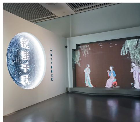
「鏡裏千秋」展覽現場。

戰國武士鬥獸紋銅鏡背面有兩組武士鬥獸圖像，十分具有戲劇性，第一組畫面中，豹子飛身躍起，武士半蹲防禦；第二組畫面中，原本豹身向前，尾巴在後的形象，轉變成豹尾衝前、豹身向後、回首張望，武士的姿勢未變，畫面生動，紋樣精美。