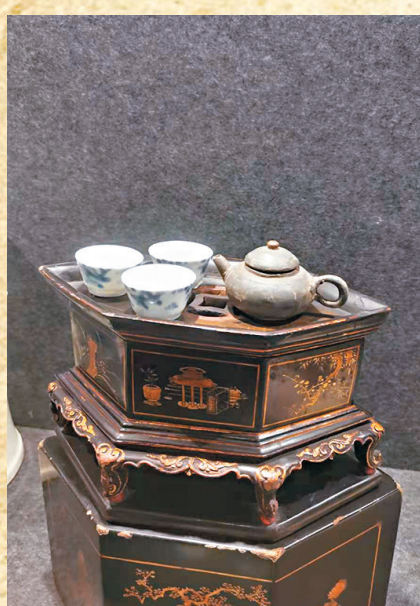
潮府功夫茶文化博物館展出的功夫茶具。