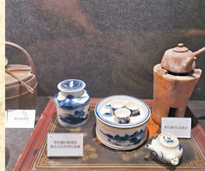
潮府功夫茶文化博物館館藏的清代潮州功夫茶具。

此外館方還從茶葉本身的使用和調養健康的功能出發，生產出茶樹沐浴露、洗髮水和健康茶點，希望通過一些文創產品和品牌的建立，增加經濟效益，也推動整個茶產業的良性發展。