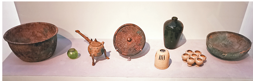
銅鏡與墓葬文化息息相關。