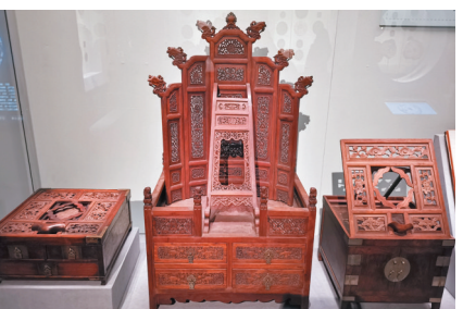
清代黃花梨鏡台一組。