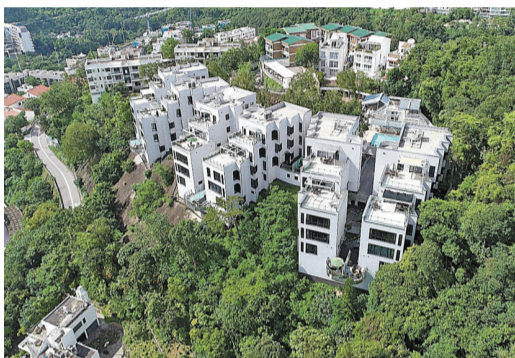
美國駐港總領事館壽臣山宿舍地皮買賣，可以說是去年市場最矚目的地產交易。

據了解，土地註冊處文件顯示，該買賣合約的協議備忘錄已完成註冊，惟業權轉讓交易仍在進行中，尚未完成轉讓手續。另外，大摩亦發表報告，給予恒隆地產增持評級，目標價22元，指公司受惠於內地奢侈品零售銷售復蘇。