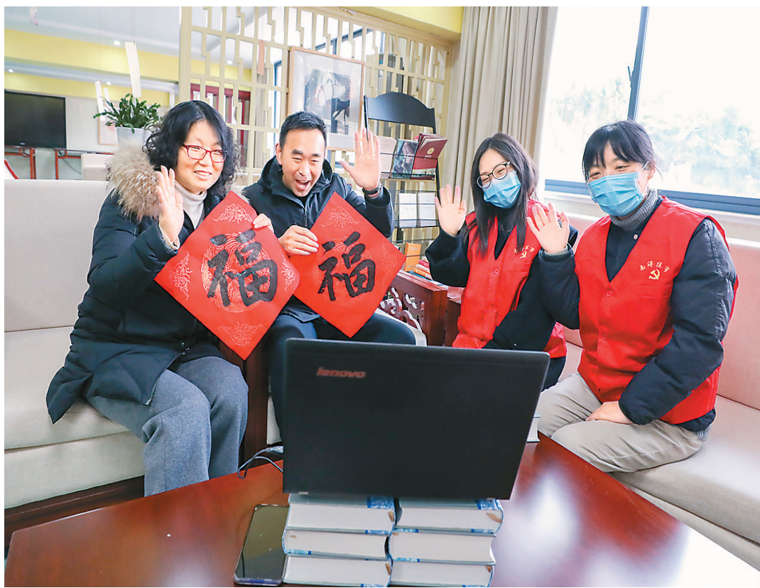
▲浙江省湖州市南浔区练市镇志愿者帮助父母通过互联网和远在海外子女“云团聚”。

2020年,国务院办公厅印发《关于切实解决老年人运用智能技术困难实施方案》的通知,向进一步方便老年人享受智能化服务迈出了坚实的一步。如今,互联网的创新应用正在逐步改变老年人的生活,让“银发网民”同样可以享受“智慧时代”的便利。