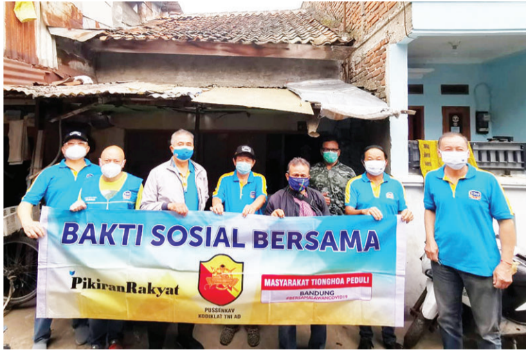
MTP 团队成员在不宜居房子前