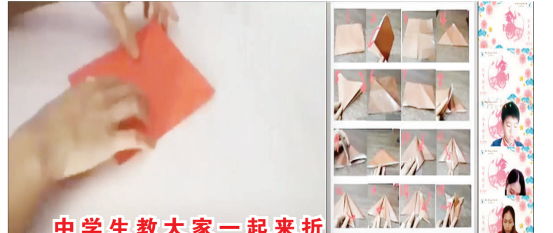
中学生教大家一起来折纸,师生们都在镜头前认真学习,分享自己的作品。