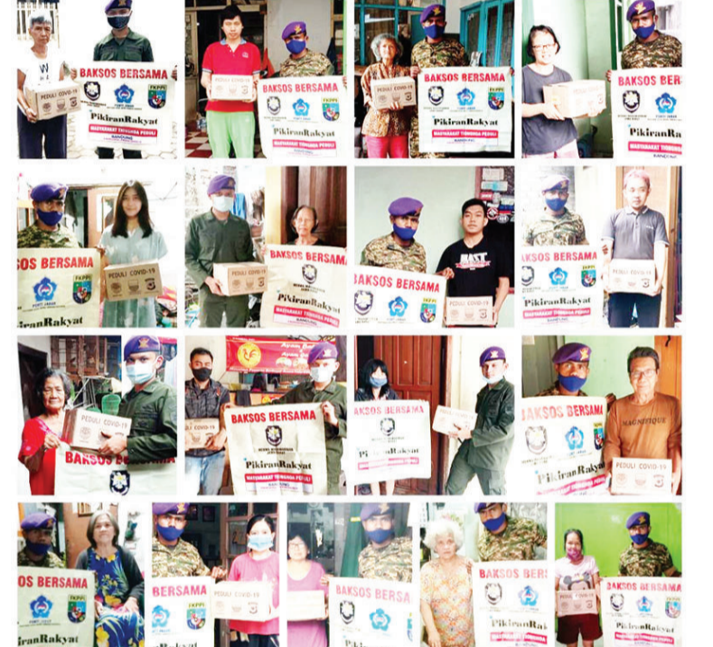
分发爱心包裹给困苦华裔