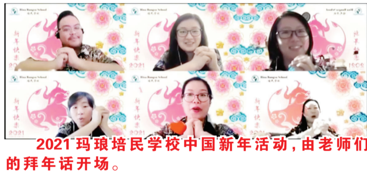
2021玛琅培民学校中国新年活动,由老师们的拜年话开场。

首先,中文老师们给大家带来提前录制好的有趣的拜年话“哞哞哞,牛年到!哞哞哞,新年好!老师们祝大家:恭喜发财!牛气冲天!”