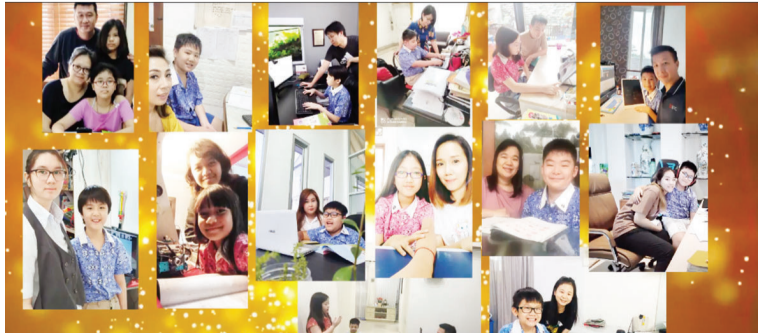
老师们也趁这个机会,向所有家长在家学习期间对学生的支持与协助,表达感谢。