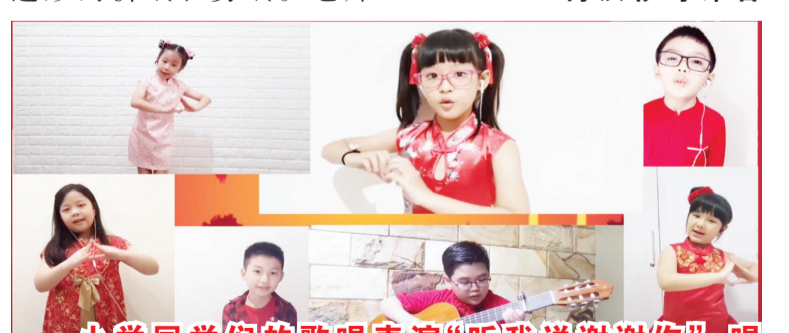
小学同学们的歌唱表演“听我说谢谢你”,唱进每个人的心里。