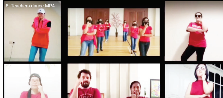
新春同乐,老师们也加入了舞蹈表演的行列,赢得满堂彩。