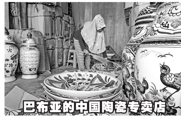
巴布亚的中国陶瓷专卖店

他补充说:“除了国家收支预算案之外,我们也可通过主权财富基金作为其它融资选项,因此如果我们能管理得当,主权财富基金的潜能是相当大的。”(Sm)