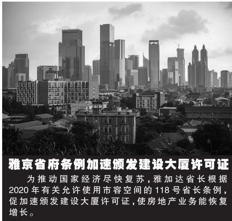
雅京省府条例加速颁发建设大厦许可证 为推动国家经济尽快复苏,雅加达省长根据2020年有关允许使用市容空间的118号省长条例,促加速颁发建设大厦许可证,使房地产业务能恢复增长。

还是负数,但比起许多国家更好。在2021年1月期间,印尼的贸易平衡表继续出现顺差,甚至顺差价值与2020年一样高,因此佐科维总统有信心,一旦新冠疫情开始缓和,业界也就根据活跃,消费市场也会复苏,工厂方面也努力生产了。(Sm)