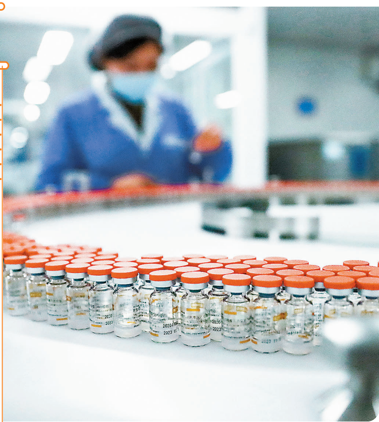
● 北京科興新冠疫苗終於獲香港疫苗顧問專家委員會「開綠燈」推薦緊急使用。圖為科興工作人員檢查自動包裝線上新冠病毒滅活疫苗標籤。

特區政府發言人16日晚表示歡迎顧問專家委員會就申請認可的疫苗作出建議，強調政府會確保疫苗符合安全、效能和質素的要求，以及按照《預防及控制疾病(使用疫苗)規例》(第599K章)相關要求及程序嚴格審批作緊急使用，方會安排市民接種。為加強公眾對疫苗的信心，政府疫苗接種工作會繼續以科學實證為根據及公開透明為原則，適時透過不同渠道向市民提供有關疫苗的最新資訊，並公布專家就疫苗提供的意見，讓市民掌握有關疫苗的正確和全面的資訊。