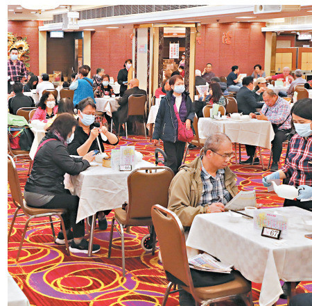
● 疫情緩和，食肆今起可恢復晚市堂食至10時，並容許4人一枱。