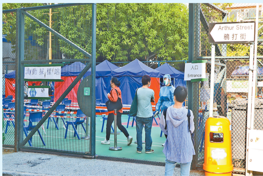
食肆即將放寬防疫措施，逾20萬從業員趕做檢測開工，令各區檢測中心預約額滿。圖為油麻地鴨打街的流動採樣站。

食至10時表示歡迎，指營業時間延長大大減低僱員被裁和放無薪假的可能性，散工亦有望復工，同時又希望政府再考慮放寬宴會人數到50至80人，讓較大型的餐飲場所亦可恢復營業。