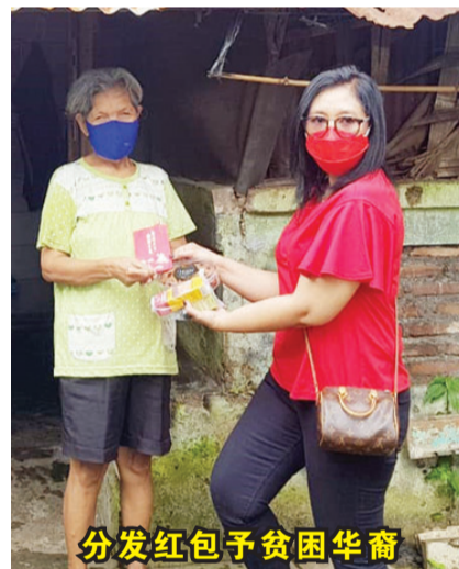
分发红包予贫困华裔

严峻,但这并没有削弱慷慨捐助者的热情和支持。因此,这不仅是红包,这次我们还提供礼包,包括:大米、面条、牛奶、鸡蛋、饼干和食用油。