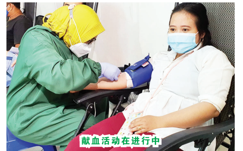
献血活动在进行中

此外,合格献血者获得礼包,包括:1公斤大米、1公升白糖、1公升食用油、一罐炼乳和5包方便面,由胡国