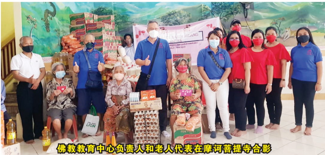
佛教教育中心负责人和老人代表在摩诃菩提寺合影

在这三个寺院分别是:Vihara Tridharma Cakra 寺院(在丹格朗,涅格拉萨里