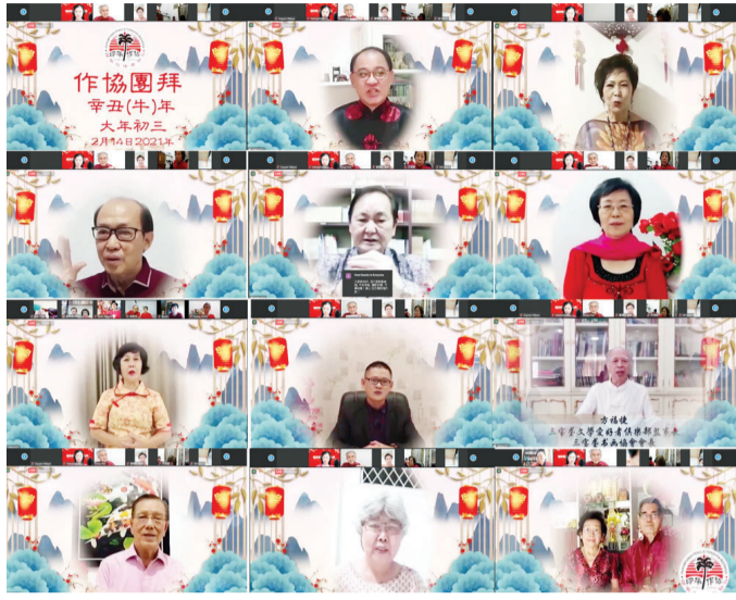
印华作协各地代表向文友们恭贺新禧。