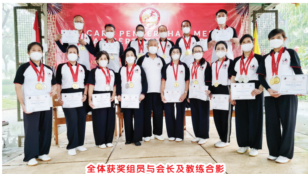
全体获奖组员与会长及教练合影