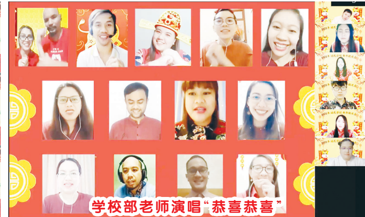
学校部老师演唱“恭喜恭喜”