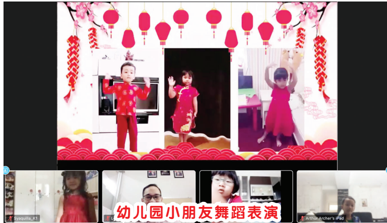
幼儿园小朋友舞蹈表演