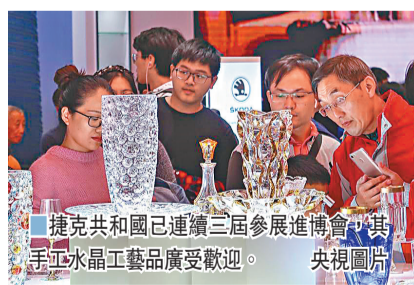
■捷克共和國已連續三屆參展進博會，其手工水晶工藝品廣受歡迎。央視圖片

今年這次峰會，是2012年中國-中東歐國家合作機制啟動以來首次舉行領導人峰會，也是在各國全力抗擊新冠肺炎疫情的特殊背景下舉行的一次峰會。 2020年是中國-中東歐國家合作機制啟動第8年，原定舉行相關會議，卻因疫情而推遲。今年2月9日，這場期待已久的峰會終於舉行。峰會由中方倡議，以視頻方式舉行。這是習主席今年1月25日出席世界經濟論壇「達沃斯議程」對話會之後第二場重要多邊外交活動。 中東歐國家國家元首、政府首腦和高級別代表出席會議。與會各方表示，習近平主席倡議並主持此次峰會意義重大，將成為中東歐國家-中國合作新的里程碑。習主席在主旨講話中說，這場峰會「表明了各國通力合作、共克時艱、共謀發展的決心」。