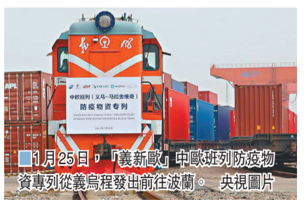
■1月25日，「義新歐」中歐班列防疫物資專列從義烏發往波蘭。