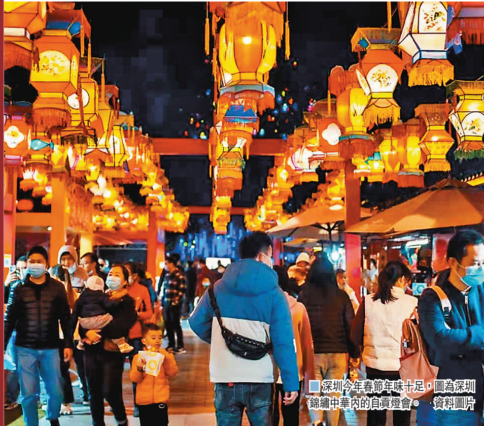
深圳今年春節年味十足，圖為深圳錦繡中華內的自貢燈會。資料圖片