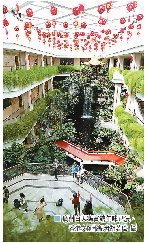
廣州白天鵝賓館年味已濃。