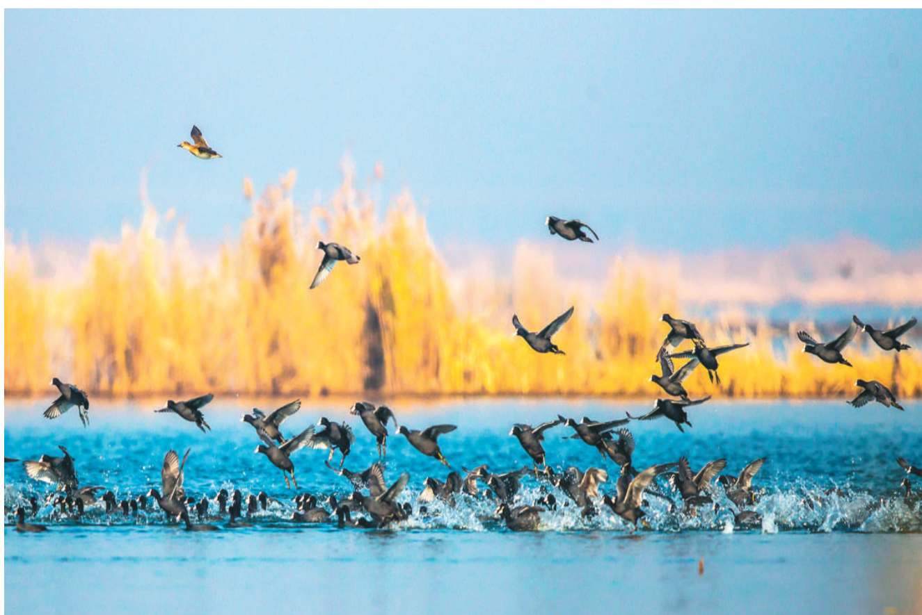
江苏省宿迁市泗洪县百万只候鸟云集洪泽湖湿地。

生物多样性保护是一个长期过程，当下的成效可能在几十年后才会显现。中国科学院空天信息创新研究院研究员牛振国认为，从长远角度来看，中国的生物多样性保护既需要不断提升科研能力，也需要普及大众的保护观念。未来几年，进一步完善自然保护区体系，精准管理，拉紧“生态保护红线”是保护生物多样性的重要措施。