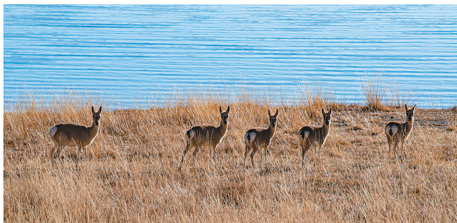
西藏羊卓雍错岸边的藏原羚。