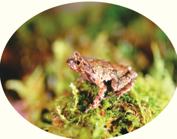
上图：浙江丽水发现一两栖动物新物种。因其模式产地在丽水境内百山祖国家公园内，故被命名为百山祖角蟾。