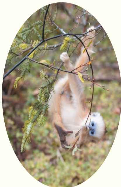
左图：金丝猴在神农架国家公园大龙潭金丝猴野外研究基地玩耍。