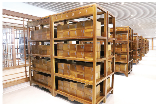
文津阁四库全书展厅。