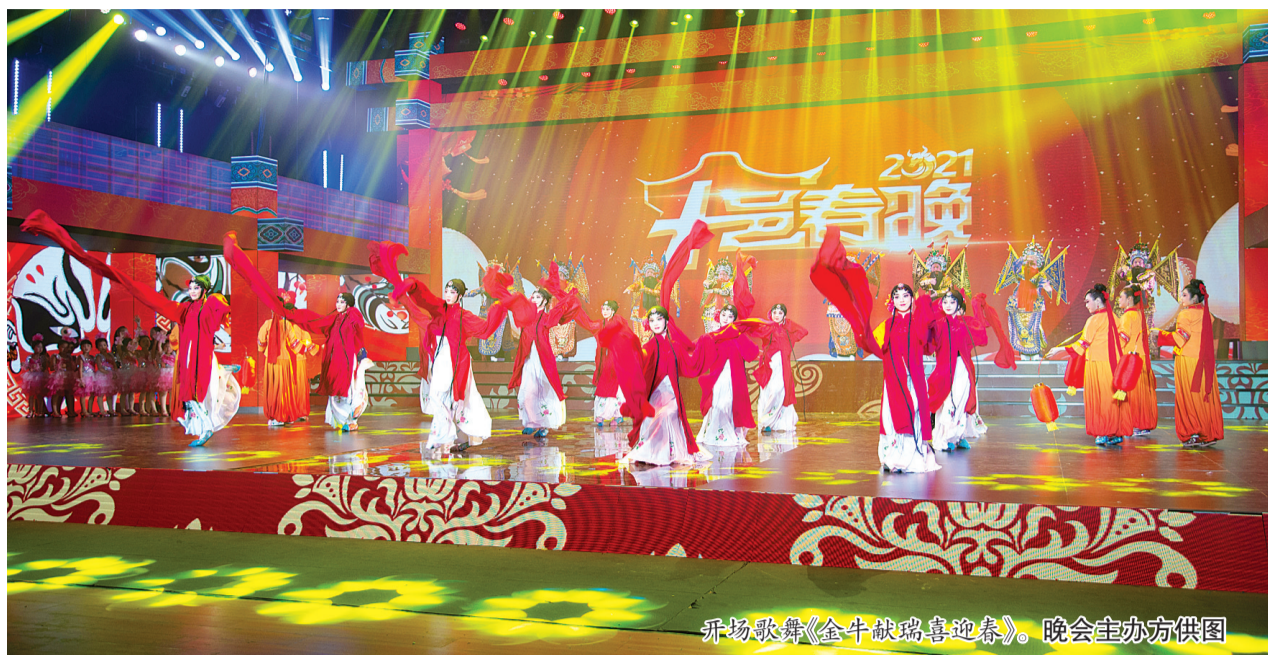
开场歌舞《金牛献瑞喜迎春》。

本届十邑春晚将十邑乡情和福州故事贯穿始终。晚会在主题曲《福佑福州》中落下帷幕。(顾伟)