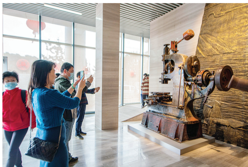
游客围观1867年法国生产的老插床。