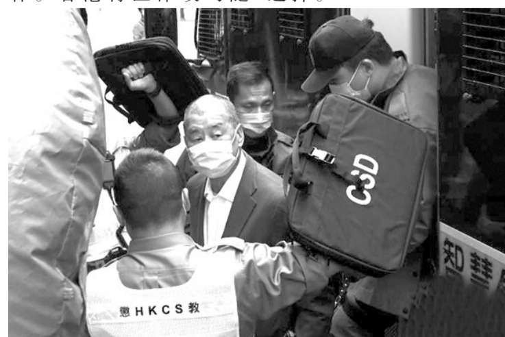
黎智英由囚车押解至香港终审法院。

中新网香港2月9日电 香港壹传媒创办人黎智英涉嫌违反香港国安法两案，早前被法院判拒绝保释后，获上诉得直，黎智英须继续还押。