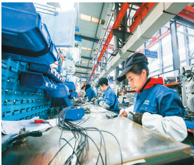
江苏恩赫兹互感有限公司日前入选国家工业和信息化部公示的第二批专精特新“小巨人”企业名单。图为工人在该企业生产线上忙碌。

日前，财政部、工业和信息化部联合印发《关于支持“专精特新”中小企业高质量发展的通知》，明确中央财政安排100亿元以上奖补资金，支持“专精特新”中小企业高质量发展。专家指出，《通知》的出台为推动中小企业高质量发展指明了方向、注入了动力。