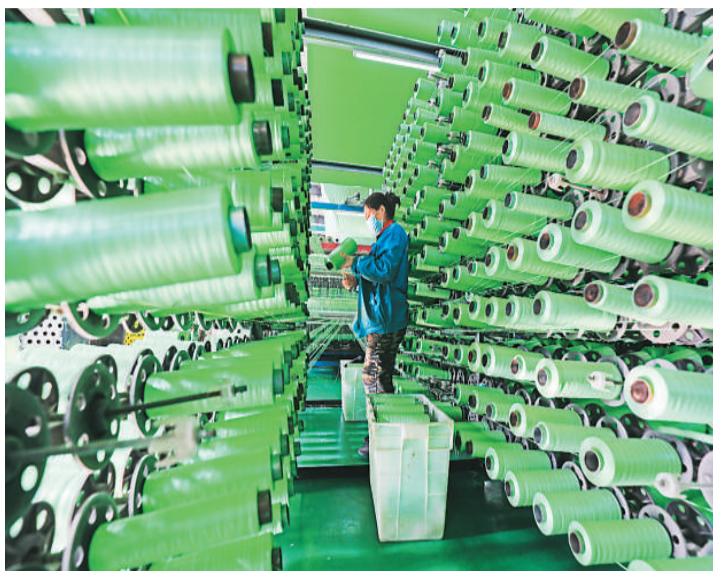
日前，河北省唐山市滦南县共有科技型中小企业392家，高新技术企业36家，成为引领县域经济增长的新引擎。图为工人在位于滦南县的唐山昊运包装有限公司生产线上工作。