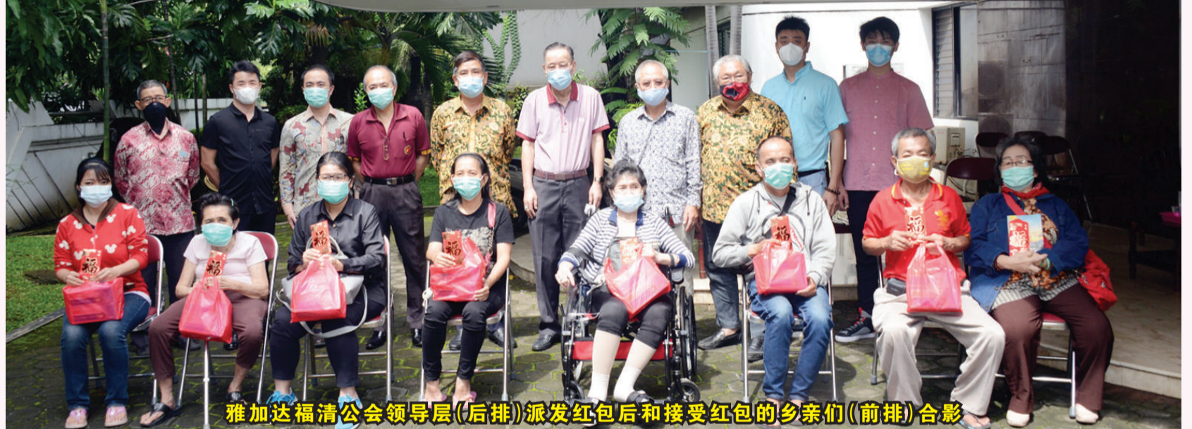
雅加达福清公会领导层(后排)派发红包后和接受红包的乡亲们(前排)合影