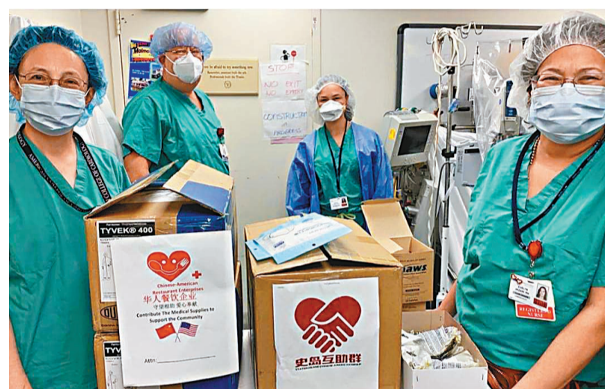
美國總統拜登4日在任內首個重要外交政策演說中表明美國仍準備好在合乎利益的情況下與中國合作。圖為紐約市史坦頓島醫護人員收到美國華人團體及華人企業捐贈的口罩。網上圖片

新華社報導，美國東部時間4日，崔天凱在中國安徽省與美國馬里蘭州政府舉辦結好40周年線上紀念活動啟動儀式上致辭作上述表示。此次活動是2021年中美省州舉辦的首場結好紀念活動。崔天凱說，很高興與看到中美兩國地方明確按下「重啟鍵」，以實際行動開啟中美友好合作的新篇章。