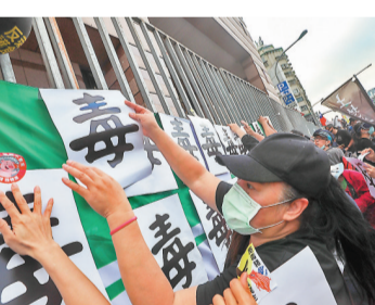
反萊豬吸引數萬台灣民眾上街遊行。圖為民眾在民進黨黨部外的鐵柵欄上張貼標語。資料圖片

民進黨當局和島內「台獨」勢力一直對美國新政府抱有不切實際的幻想。奉勸民進黨當局和島內「台獨」分子不要再死鴨子嘴硬、自欺欺人了。只有承認「九二共識」，停止謀「獨」挑釁，兩岸關係才能改善發展，台海才有和平穩定，捨此別無他路。如果蔡英文之流不知輕重、一意孤行，必將付出沉重的代價！