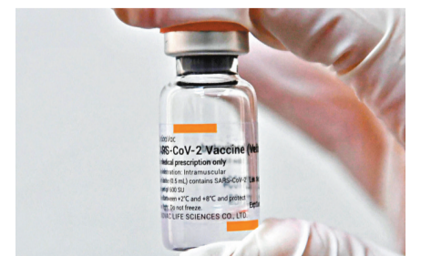
馬克龍表示，中國在生產及出口疫苗方面的效率「令我們略感羞憤」。圖為上月出口土耳其的一劑科興疫苗。

據彭博社消息，馬克龍4日的講話中還呼籲中國提高新冠疫苗接種的透明度，因為目前有關中國疫苗接種的細節較少。他同時表示，中國在生產及出口疫苗方面的效率「令我們略感羞憤」。