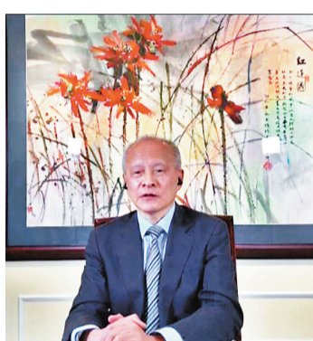
美國東部時間4日，崔天凱在中國安徽省與美國馬里蘭州政府舉辦結好40周年線上紀念活動啟動儀式上表示，當前中美關係要以建設性的態度尋求合作的最大公約數。網上圖片

香港文匯報訊 綜合報導：美國總統拜登4日發表他任內首個重要外交政策演說中公布了美國在外交政策上的重大轉變，強調：「美國已回來，外交已回歸成為重心」。拜登表明中國是美國最主要的競爭對手，但美國仍準備好在合乎利益的情況下與中國合作。而中國駐美大使崔天凱當日在華盛頓一場紀念活動上也表示，當前中美關係處於關鍵階段，要着眼大局和長遠，以建設性的態度尋求合作的最大公約數，重開對話，重啓合作，重建互信，推動中美關係重回正軌。