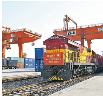
2020年中東歐17國貿易額達到1,034.5億美元。圖為中歐班列(西安)運回2021年首趟「洋年貨」。