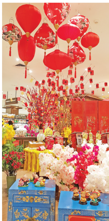
商场农历新年的节日装饰

【本报讯】为迎接春节，印尼商场租户协会(HIPPINDO)展开促销活动，疫情期间以支持经济复苏。