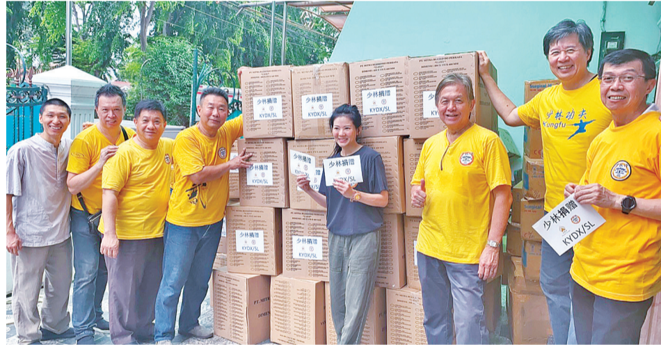
印尼积极响应少林寺慈善捐助号召