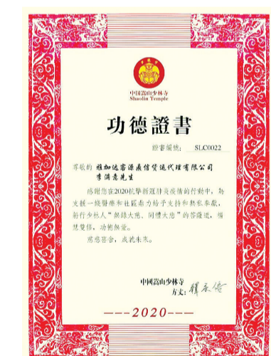
客源鼎信李满意功德证书