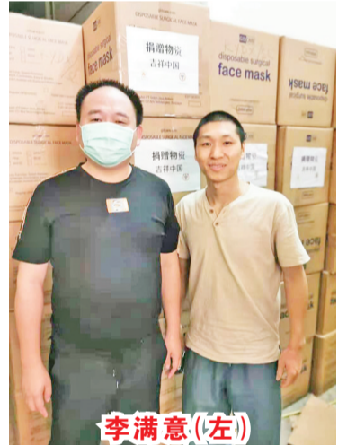
摄于捐赠防疫物资前

【本报讯】2021年2月4日,农历腊月二十三,中国嵩山少林寺举行全球少林慈善表彰网络会议,以表彰自2020年新冠疫情蔓延以来,在疫情防控工作中做出突出贡献的团体及个人。来自全球二十余家少林文化中心及少林弟子接受河南省慈善总会及中国嵩山少林寺的表彰。