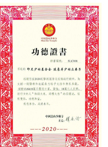
印尼少林基金会功德证书

庚子春节前夕,一场突如其来的新冠肺炎疫情开始迅速向全国蔓延,随之而来的是医疗物资的紧缺。少林寺立即筹划捐助行动,并发出倡议:“因疫情严重,物资短缺,吾等佛子,当发慈悲心,行菩萨道,尽释迦子之本体!”少林寺方丈释永信大和尚带领常住僧众,率先捐出个人单金及善款,并向海外少林文化中心发出倡议,号召全球少林弟子寻