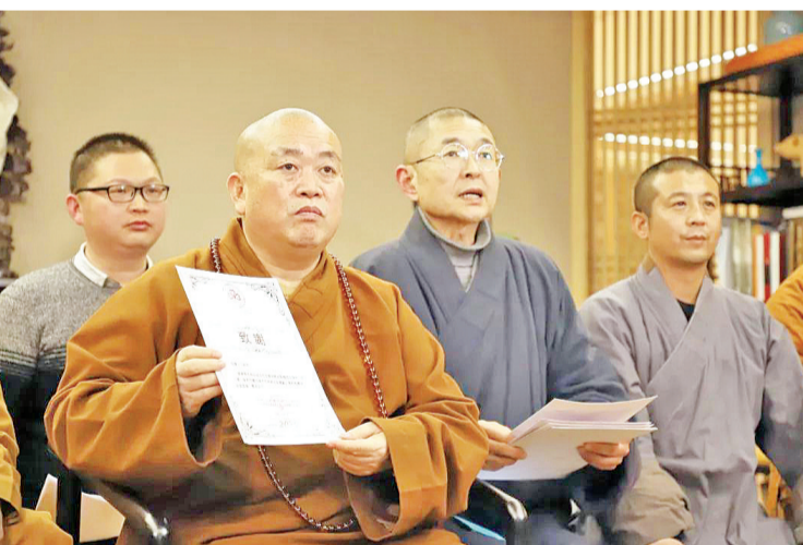
少林寺方丈释永信大和尚颁发荣誉证书