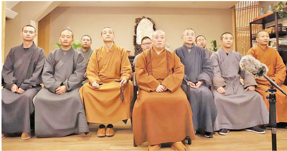
全球少林慈善表彰网络会议主会场