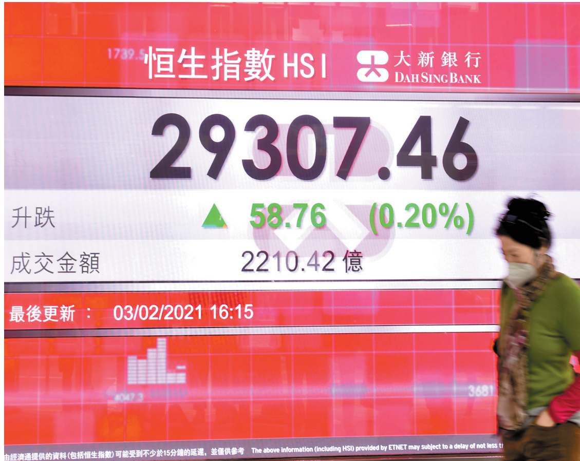
恒指昨天先跌後升，最終收報29307點，升58點，重上10天線。

【香港商報訊】記者張智榮報導：港股高位調整後，至昨日連升3天累積反彈逾千點，企穩29000點樓上並收復10天線。恒生指數昨收報29307點，升58點或0.2%。摩根士丹利(簡稱「大摩」)預期，全年南下資金淨流入1300億美元(逾1萬億港元)是完全有可能的事。大摩解釋，全年淨流入1300億美元的預測，是基於內地互惠基金及機構投資者的購買力，以及資本帳流入流出的估算。