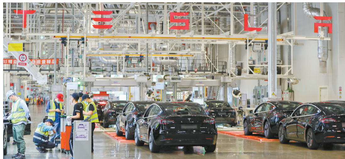
上海自貿區臨港新片區內的特斯拉上海超級工廠。

【香港商報訊】記者童越報道：商務部3日召開「十三五」時期自貿試驗區建設情況專題新聞發布會。會上，商務部自貿區港司司長唐文弘透露，2020年，前18家自貿試驗區共新設企業39.3萬家，實際使用外資1763.8億元，實現進出口總額4.7萬億元，以不到全國千分之四的國土面積，實現了佔全國17.6%的外商投資和14.7%的進出口，為穩外貿穩外資發揮了重要作用。