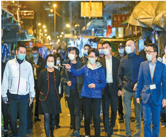
特首林鄭月娥及一眾官員前天深夜赴深水埗受限區域一帶巡視。

【香港商報訊】記者何加祺報道：特區政府進一步加強強制檢測力度，昨要求所有確診個案密切接觸者的同住成員接受新冠肺炎病毒核酸檢測。在強檢力度不斷提升之下，本港疫情終現回落趨勢，昨日新增確診個案19宗，創去年11月20日以來新低，至今累計個案為10530宗。當天全為本地個案，其中7宗源頭不明，另有約20宗初步確診個案。衛生署衛生防護中心傳染病處主任張竹君表示，雖然確診個案有所緩和，惟仍有7宗源頭不明，背後都各有傳播鏈，目前不能說疫情完全受控，呼籲市民不可輕視。