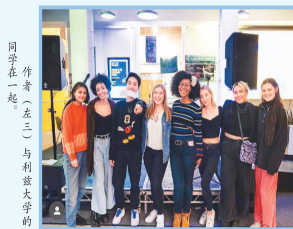
作者（左三）与利兹大学的同学在一起。

凭借刻板印象给人归类是非常不理智、不准确，甚至有些粗鲁的做法。留学的日子里，我在社团、义工项目、公司开放日以及现在设立的国际学生咨询会中，接触了大量来自不同文化背景的学生，每个人都是不同的，家庭背景、学习方式、待人处事……大家各有所长，也绝非完美，但不同的背景教会我们彼此用不同的思维方式和出发点去看待问题。