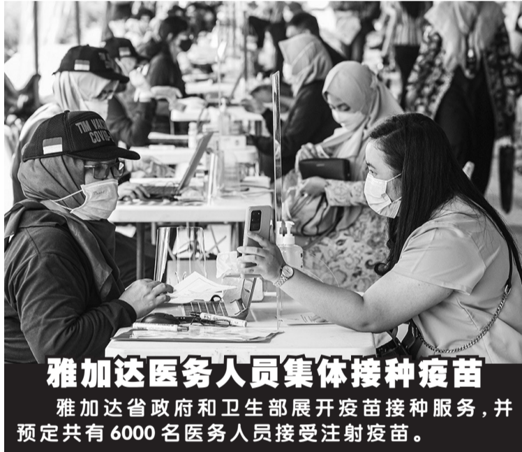
雅加达医务人员集体接种疫苗 雅加达省政府和卫生部展开疫苗接种服务,并预定共有6000名医务人员接受注射疫苗。

埃里克说:“很抱歉,我不能透露准备在股市挂牌上市的国企子公司的准确数据,因为我不想有人试图从中谋取暴利。”