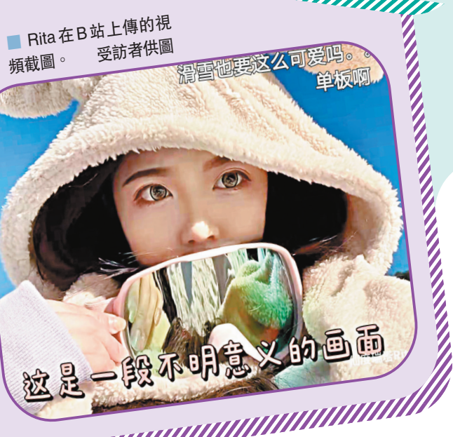
Rita在B站上傳的視頻截圖。