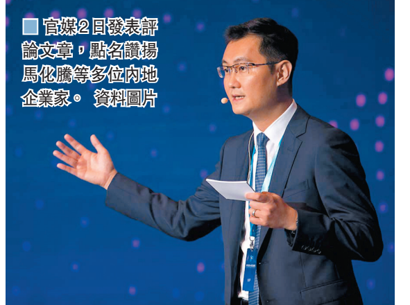
官媒2日發表評論文章，點名讚揚馬化騰等多位內地企業家。資料圖片

建銀國際2日的報告指出，看好阿里電商的長期變現能力，且阿里進駐社區團購，擴充生鮮、快消品類銷售業務，同時提升基礎設施建設，有助長期估值的提升，維持該股目標價361元。