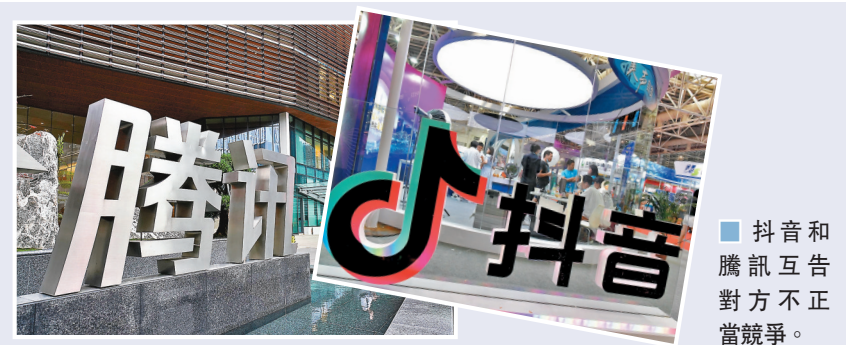
抖音和騰訊互告對方不正當競爭。

內地的市場監管總局在去年末，對阿里巴巴的涉壟斷立案調查，吹響互聯網反壟斷的執法號角。業內人士預計，2021年反壟斷執法將繼續強化，騰訊、美團等平