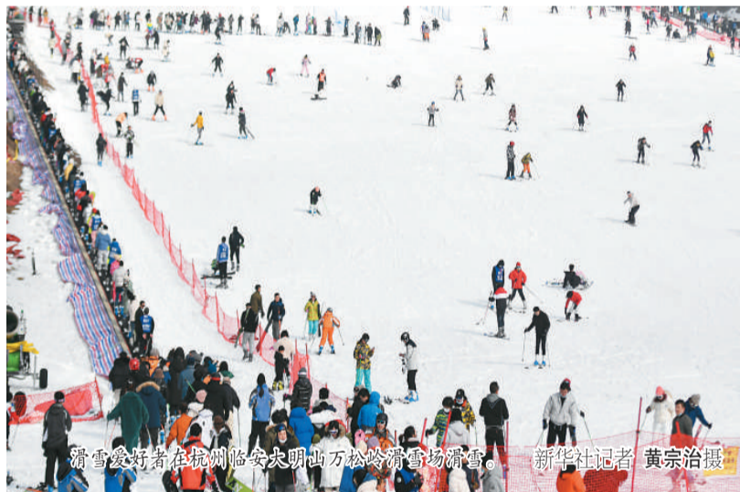
滑雪爱好者在杭州临安大明山万松岭滑雪场滑雪。