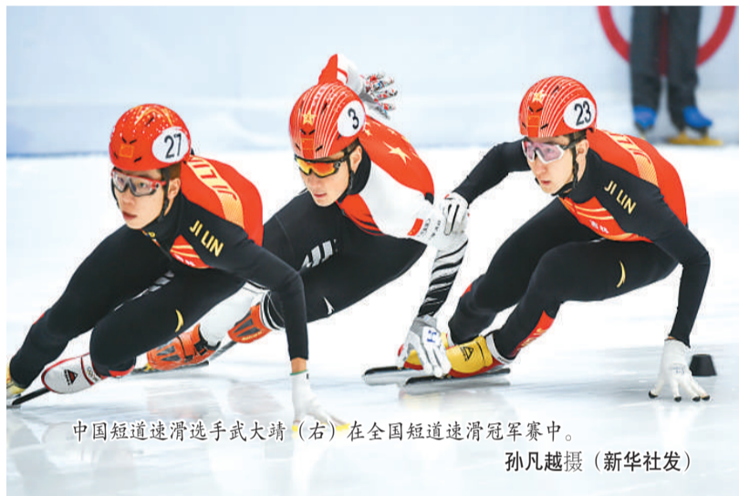
中国短道速滑选手武大靖（右）在全国短道速滑冠军赛中。