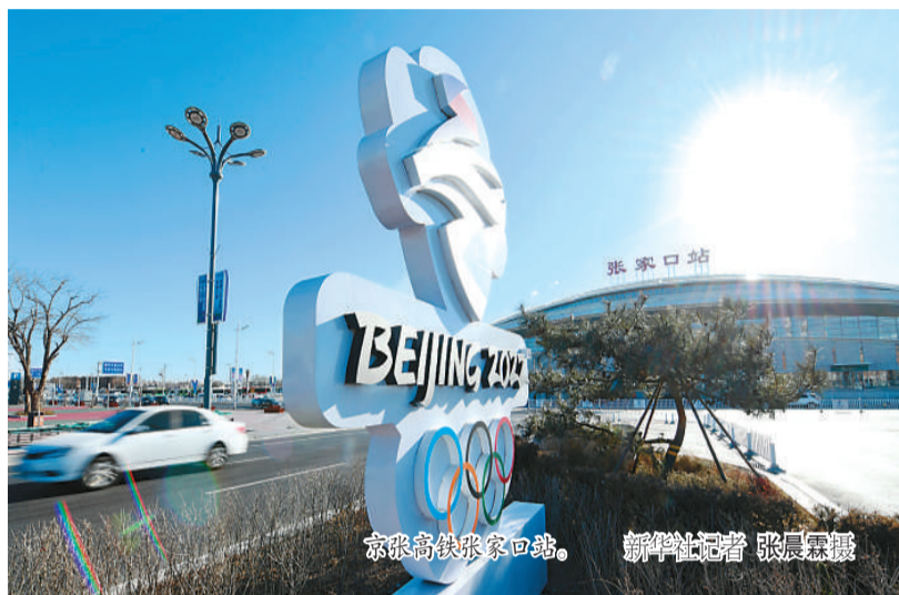
北京冬奥会张家口站。

站在时间节点之上，中国冰雪的脉搏越发强烈。回首来路，北京冬奥从申办到筹办进展顺利，“中国速度”令世人瞩目；面向前方，奥运圣火持续升温，“冬奥之城”正静待八方来客，努力为世界奉献一届精彩、非凡、卓越的奥运盛会。