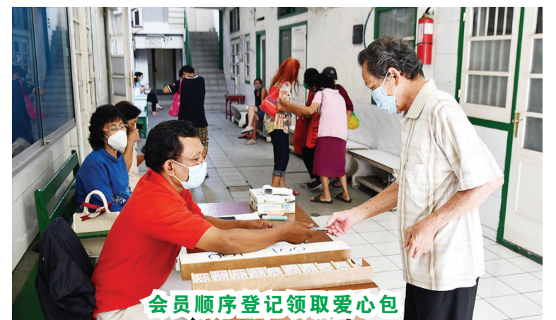
会员顺序登记领取爱心包