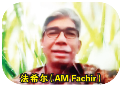
法希尔 (AM Fachir)

【本报讯】雅加达咨询集团(JCG)于2月2日周二下午通过视讯会议举行“JCG CALM 支持经济外交论坛”。