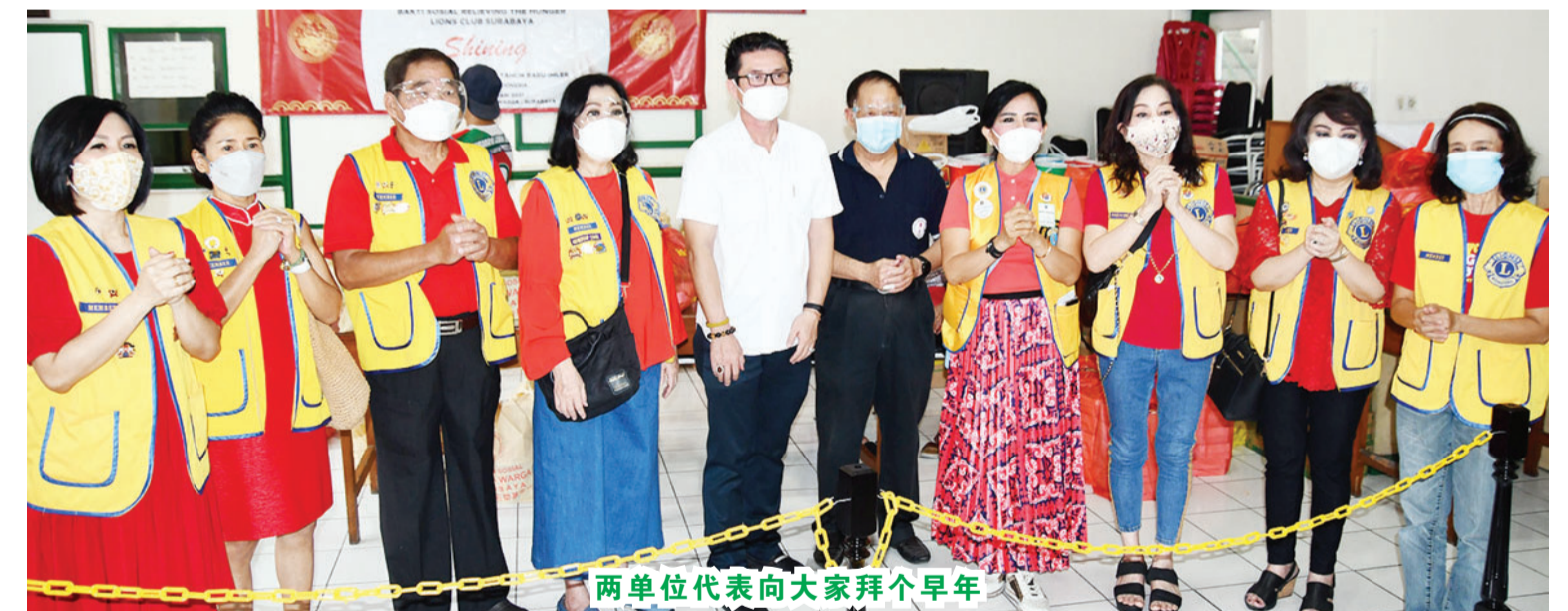
两单位代表向大家拜个早年