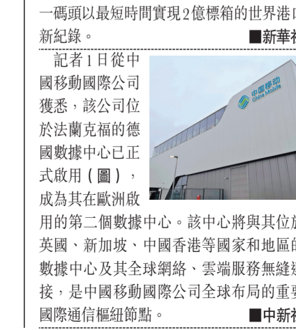
中國移動國際公司