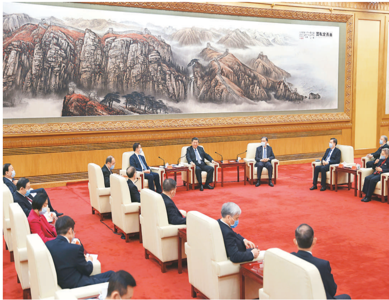
二月一日,习近平、汪洋、韩正等在北京人民大会堂同党外人士欢聚一堂,共迎佳节。

在听取万鄂湘致辞后,习近平发表了重要讲话。他强调,2020年是新中国历史上极不平凡的一年。面对严峻复杂的形势任务、前所未有的风险挑战,中共中央团结带领全党全国各族人民齐心协力、迎难而上,统筹疫情防控和经济社会发展,统筹深化改革开放和应对外部压力,统筹抓好“六稳”工作和落实“六保”任务,决胜全面建成小康社会、决战脱贫攻坚,经过艰苦努力,疫情防控取得重大战略成果,经济增长率先实现由负转正,脱贫攻坚任务如期