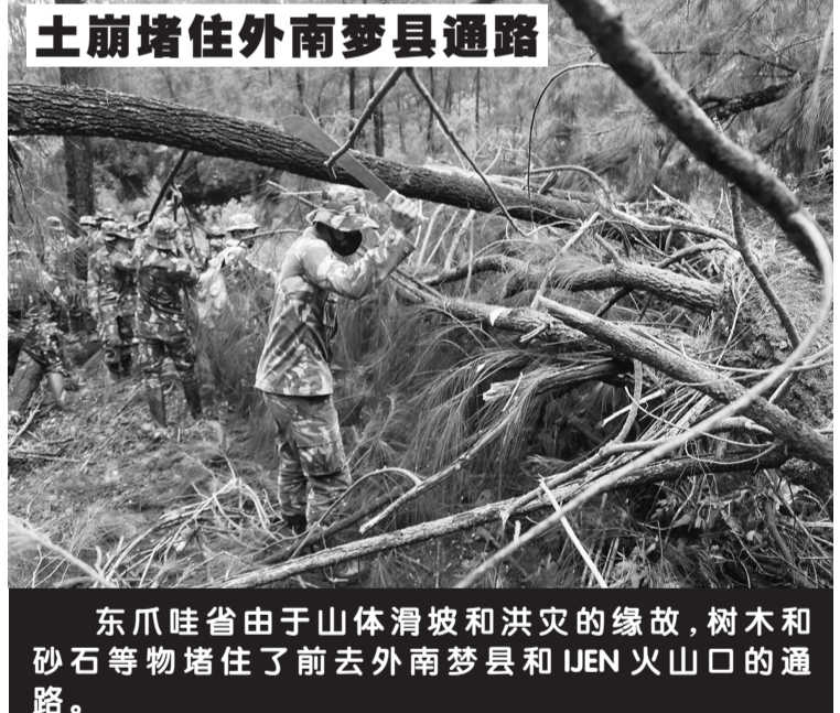
土崩堵住外南梦县通路 东爪哇省由于山体滑坡和洪灾的缘故,树木和砂石等物堵住了前去外南梦县和JEN火山口的通路。

(5个新水库和修建43座水库),以及建设42个储水池、新建2.5万公顷灌溉区和修建25万公顷灌溉网。