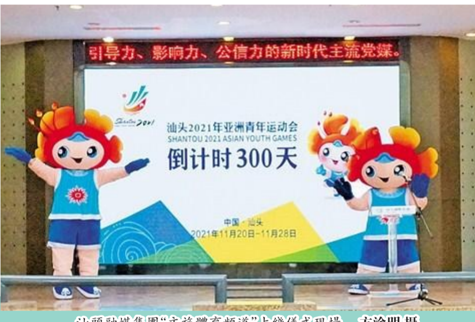
汕頭融媒集團“文旅體育頻道”上綫儀式現場。

為全方位宣傳亞青會，向世界全面展現汕頭的良好形象，經中國國家廣播電總局批准，汕頭廣播電視公共頻道調整為文旅體育頻道，經過兩個多月