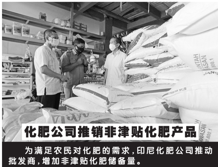
化肥公司推销非津贴化肥产品 为满足农民对化肥的需求,印尼化肥公司推动批发商,增加非津贴化肥储备量。

根据如上即将出炉的政府条例第33条的解说:“中央政府要提供担保就必须事先考虑国家财政能力、财政可持续性、和国家预算案风险管理原则。” 在国家战略项目的执