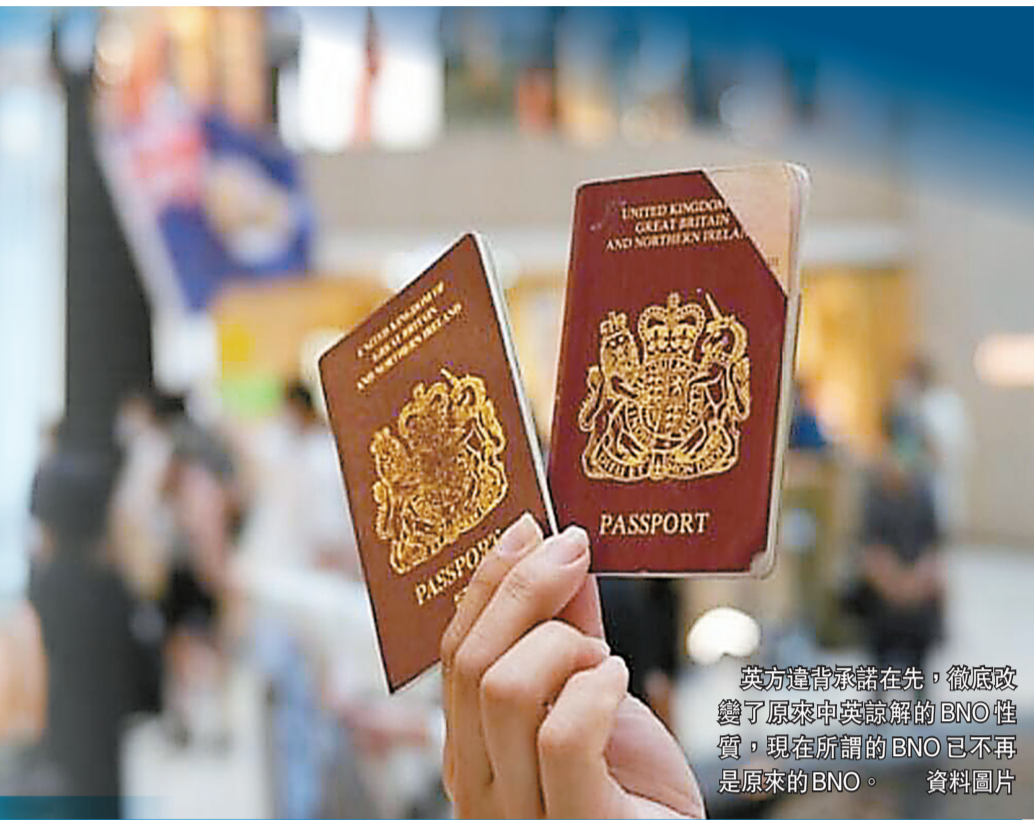
英方違背承諾在先，徹底改變了原來中英諒解的BNO性質，現在所謂的BNO已不再是原來的BNO。資料圖片

基於上述，中方認為：英方將BNO擴權並以此給港人英國居留權，顯然違反備忘錄，亦公然違背承諾。