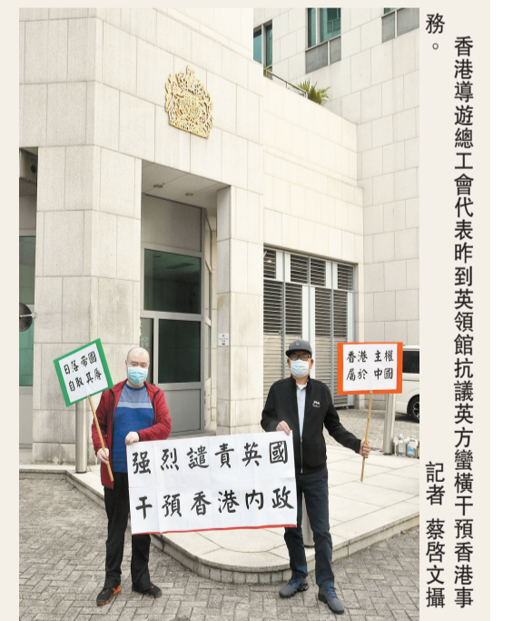
香港導遊總工會代表昨到英領館抗議英方蠻橫干預香港事務。

港區全國人大代表、新界社團聯合會理事長陳勇指，英方違諾在先，中國反制合法、合情、合理。他提醒港人，現時國家發展一日千里，灣區更是機遇處處；英國地方不大，經濟不彰，反移民情緒高漲。故此，港人不可衝動，要認清途徑。