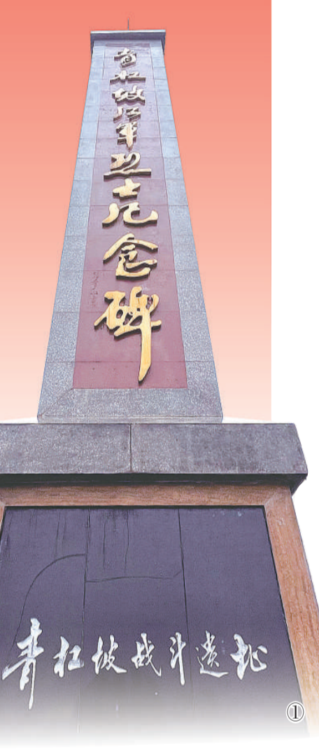
图①：青杠坡红军烈士纪念碑。

走出纪念馆，夜幕降临，华灯初上，行走在土城老街的青石板路上，小院里一家老小正围坐在电视机前吃饭，其乐融融；黄桷古树下，居民们欢快地跳着广场舞；长街被一排排温馨的大红灯笼点亮，红色灯光的映照下，四处洋溢着安详……艰难的岁月虽已远去，民族复兴伟业还在征途，我们每一名共产党员都应该坚守这份信仰，为国家