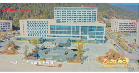
楊斐君 張曉鑫 黃德志 劉舒)

奮進之聲催人進，快馬加鞭又一程。站在“十四五”開局之年，大埔不斷補短板、強弱項、增動能，為打造生態經濟發展新標杆，建設宜居宜業宜游“世界客都·長壽梅州”作出大埔貢獻，以優異成績向建黨100周年獻禮！（無綫梅州 魏博林