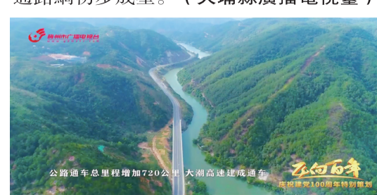
公路通車總裏程增加720公里 大潮高速建成通車

路、國道G235綫、省道S222綫等升級改造項目扎實推進，以縣城為中心放射狀交通路網初步成型。（大埔縣廣播電視臺）