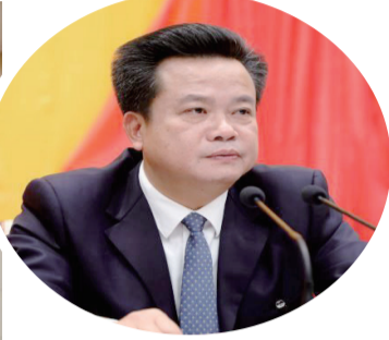
▲大埔縣委書記朱漢東

會議強調，今年重點要抓好八項工作： 一要用更強擔當守護綠水青山。綠色是大埔發展最亮的底色，要持續打好污染防治攻堅戰，深入開展藍天、碧水、淨土保衛戰，落實林長制和河長制，深入實施“綠滿梅州”行動，嚴格保護飲用水源地，加強韓江流域水質保護，讓綠色家底更加厚實。堅決踐行“兩山”理念，充分發揮“世界長壽鄉”品牌效應，推動生態產業化、產業生態化，讓綠色釋放更多紅