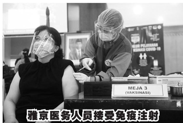
为协助医务人员获得新冠病毒入侵的抵抗力, 雅加达卫生局已展开集体免疫注射行动。