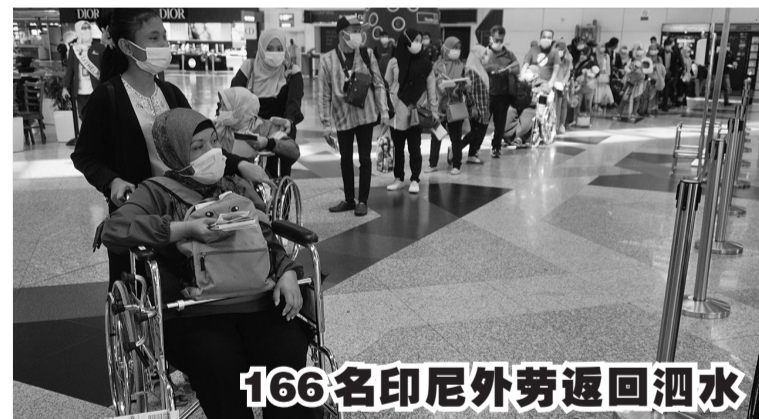
1月30日, 印尼驻吉隆坡大使馆和旅居马来西亚的印尼社会组织联盟的协助下, 共有166名印尼外劳搭乘 Citilink QG 8553 班机, 从吉隆坡直接返回泗水。

代表1月30日在雅加达南区举行记者会时表示, “施工期只有一年, 因此我们将在今年中旬开始动工, 明年中旬完成装置系统的工作。按计划, 我们首先将在雅加达和周边区的高速公路安装不接触非现金高速公路交易系统, 接下来是爪哇和巴厘, 然后轮到全国各地。” 值得一提的是, 有很多发达国家都已使用了此种系统, 比方说欧盟国家的斯洛伐克、德国、捷克、俄罗斯、匈牙利和比利时等。亚太地区的澳大利亚和新加坡等地的高速公路, 也会在近期改用基于卫星的系统技术收费。 (Sm)