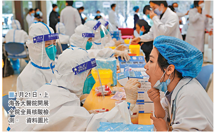
1月21日，上海各大醫院開展全院全員核檢。

2例樣本經上海市疾控中心覆核，核檢檢測結果為陽性，隨後又排出一例樣本，共計3例。從當日起，疫情防控新聞發布會密集召開，權威部門及時公開正面闢謠，院士專家教民衆做好個人防護