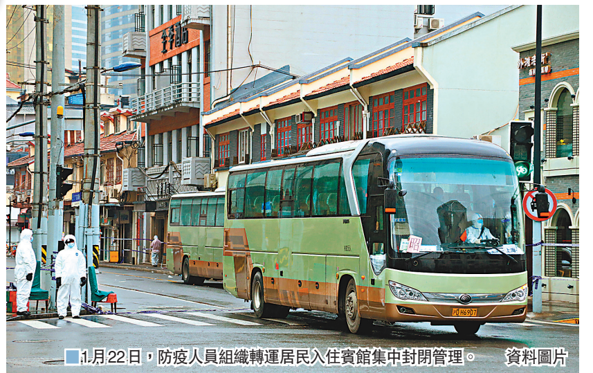
1月22日，防疫人員組織轉運居民久住賓館集中封閉管理。資料圖片