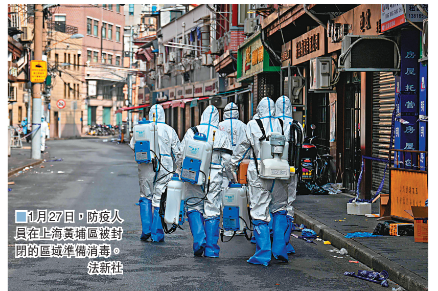
1月27日，防疫人員在上海黃浦區被封閉的區域準備消毒。

新增21日患者密接者病例，上海市市長龔正宣布，上海疫情已經基本控制。安排核檢檢測累計篩查4.1萬多人，並沒有進行全員篩查。只封閉了3個發現確診病例的小區和1個酒店，並及時充分保障市民生活物資；不涉及疫情的醫院照常開門接診，主動優化流程，加快就診速度，為患者提供便利；其他公共場所加強了戴口罩、查驗健康碼、測體溫等舉措，盡量不給市民添過多麻煩