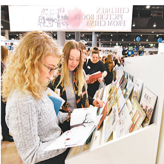
2016年10月，“中国孩子的书香世界”儿童绘本专题展在德国法兰克福书展上首次亮相。图为展览现场。