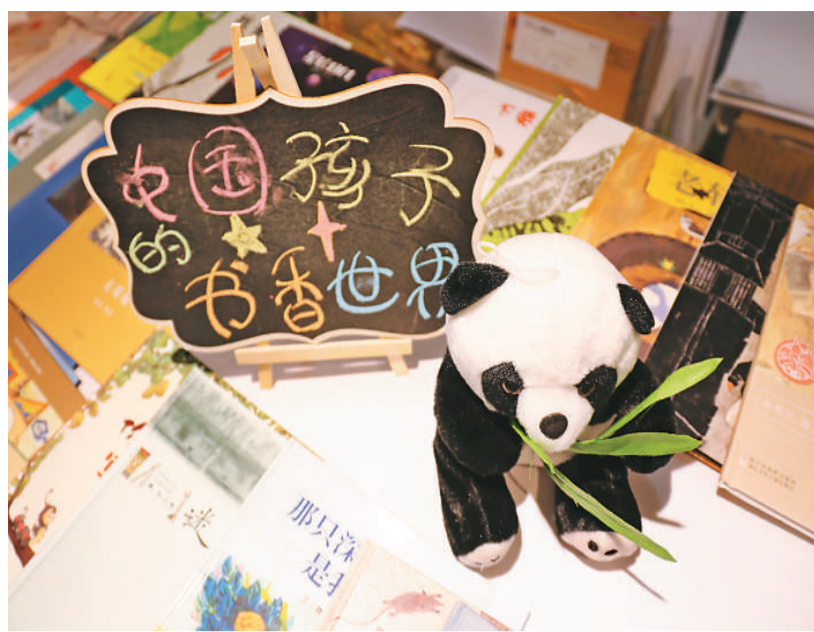
2019年，“中国孩子的书香世界”绘本展暨绘画比赛在泰国举行。图为展览展台。