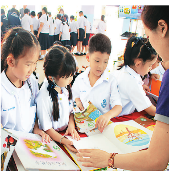
2020年11月4日，“中国孩子的书香世界”在泰国曼谷拉差威尼小学巡展。图为展览现场。