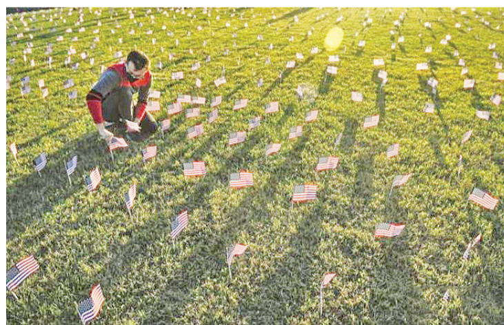
资料图:当地时间2020年9月21日,美国华盛顿,志愿者在国家广场上放置2万面美国国旗,纪念新冠疫情期间死亡的近20万人。

中新网1月29日电 据路透社报道,位于美国加州惠蒂尔的玫瑰山纪念公园和殡仪馆可能是北美地区最大的公墓,由于新冠死亡人数增加,这个1400英亩的墓园正努力应对大量的葬礼服务需求。