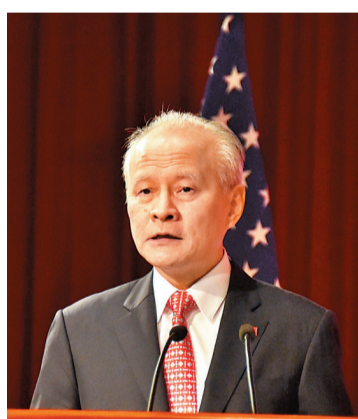
■崔天凱指出，中美之間只有「合作」這項唯一正確的選擇，美國應該要以理性與誠意面對中國。中新社

香港文匯報訊 據人民日報客戶端報道，美東時間1月27日晚，中國駐美國大使崔天凱出席「中美接觸42年：過去的成就，未來的調整」線上對話會，並發表致辭。崔天凱表示，中美關係走到新的十字路口，中美兩國必須緊密相連，重建尊重、信任和正常關係，希望正直、坦誠、尊重和遠見能夠回歸美國對華政策。