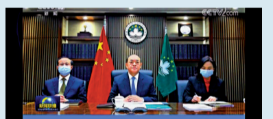
■賀一誠（中）匯報澳門過去一年的工作和當前形勢。

習近平表示，一年來，林鄭月娥和特別行政區政府沉着應對修例風波、新冠肺炎疫情和外部環境不利變化帶來的多重嚴重衝擊，想方設法維護秩序、防控疫情、紓緩民困、恢復經濟，已取得一定的成效。特別要指出的是，全國人大常委會制定頒布香港國安法後，林鄭月娥帶領特別行政區政府堅決執行，依法止暴制亂，努力推動香港重回正軌。在涉及國家安全等大是大非問題上，林鄭月娥立場堅定、敢於擔當，展現出愛國愛港的情懷和對國家、對香港高度負責的精神。中央對林鄭月娥和特別行政區政府履職盡責的表現是充分肯定的。