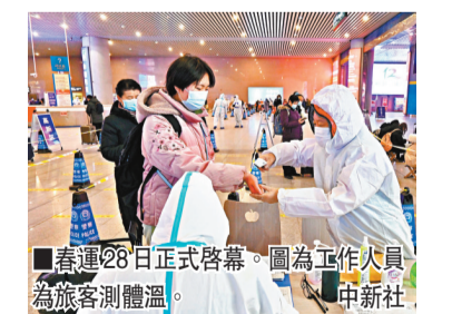
■春運28日正式啓幕。圖為工作人員為旅客測體溫。