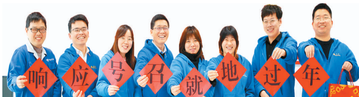
选择就地过年的外来人员日前收到浙江省台州市路桥区蓬街镇组办送上的新春红包。

作为团队的主心骨,我必须未雨绸缪,想办法为员工解除后顾之忧,让他们安全、健康、快乐地留下过好年。 黄自宏整理